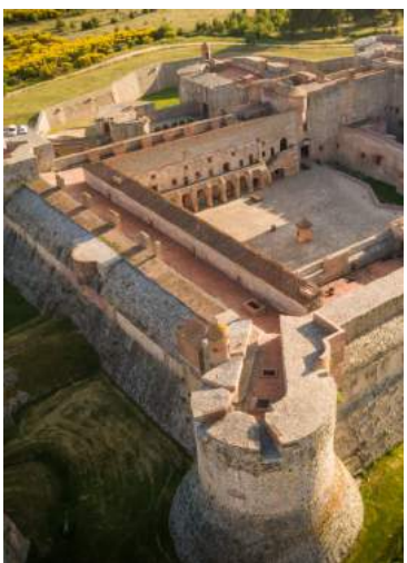
Forteresse de Salses