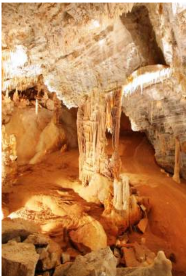
Gouffre géant de Cabrespine