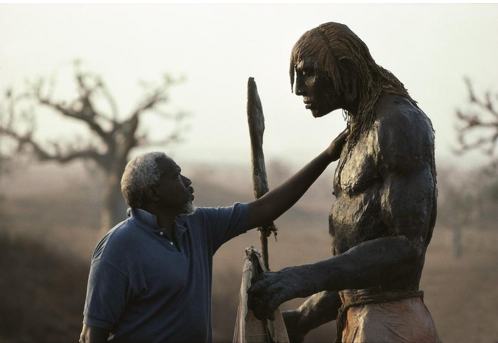
Ousmane Sow et le Guerrier debout

L'exposition est organisée dans le cadre de la 9e édition de IN SITU Patrimoine et Art Contemporain en Occitanie, portée par l'association Le Passe Muraille.