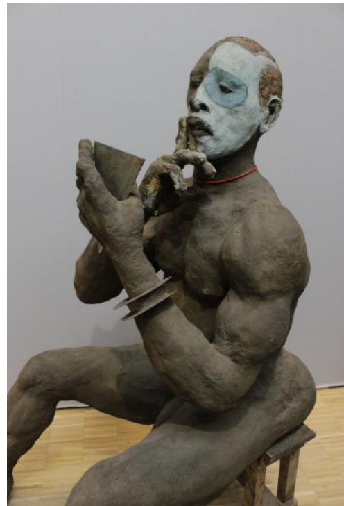
Le Nouba qui se maquille Inédit - 1987 - technique mixte 120x110x105 - 150 kg

C'est seulement dix ans plus tard qu'Ousmane Sow entreprend la création de la série Petits Noubas , estimant n'avoir pas abouti la série Nouba de 1984 et souhaitant y ajouter quelques thèmes.